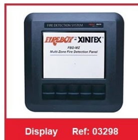
Display Ref: 03298