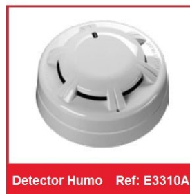
Detector Humo Ref: E3310A