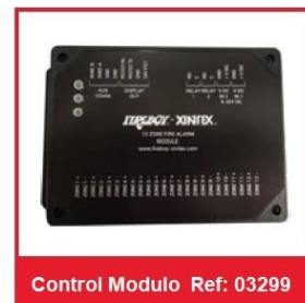
Control Modulo Ref: 03299