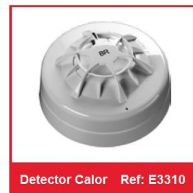
Detector Calor Ref: E3310