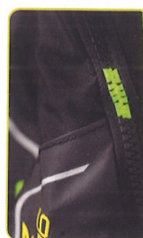
Funda flexible con cremallera