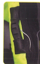
Puño de disparo de acción rápida, ergonómico e integrado al chaleco