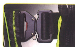
Cierre rápido « Stab-lock » en aluminio

*Versión requerida por numerosos reglamentos de regata ISO 12402-8).