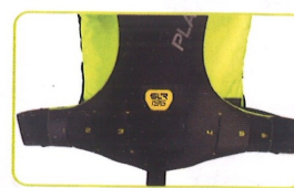
Cintura « Quick fit » con cincha integrada dentro del chaleco. 6 regulaciones de ajuste rápido. Tejido reforzado con efecto carbono